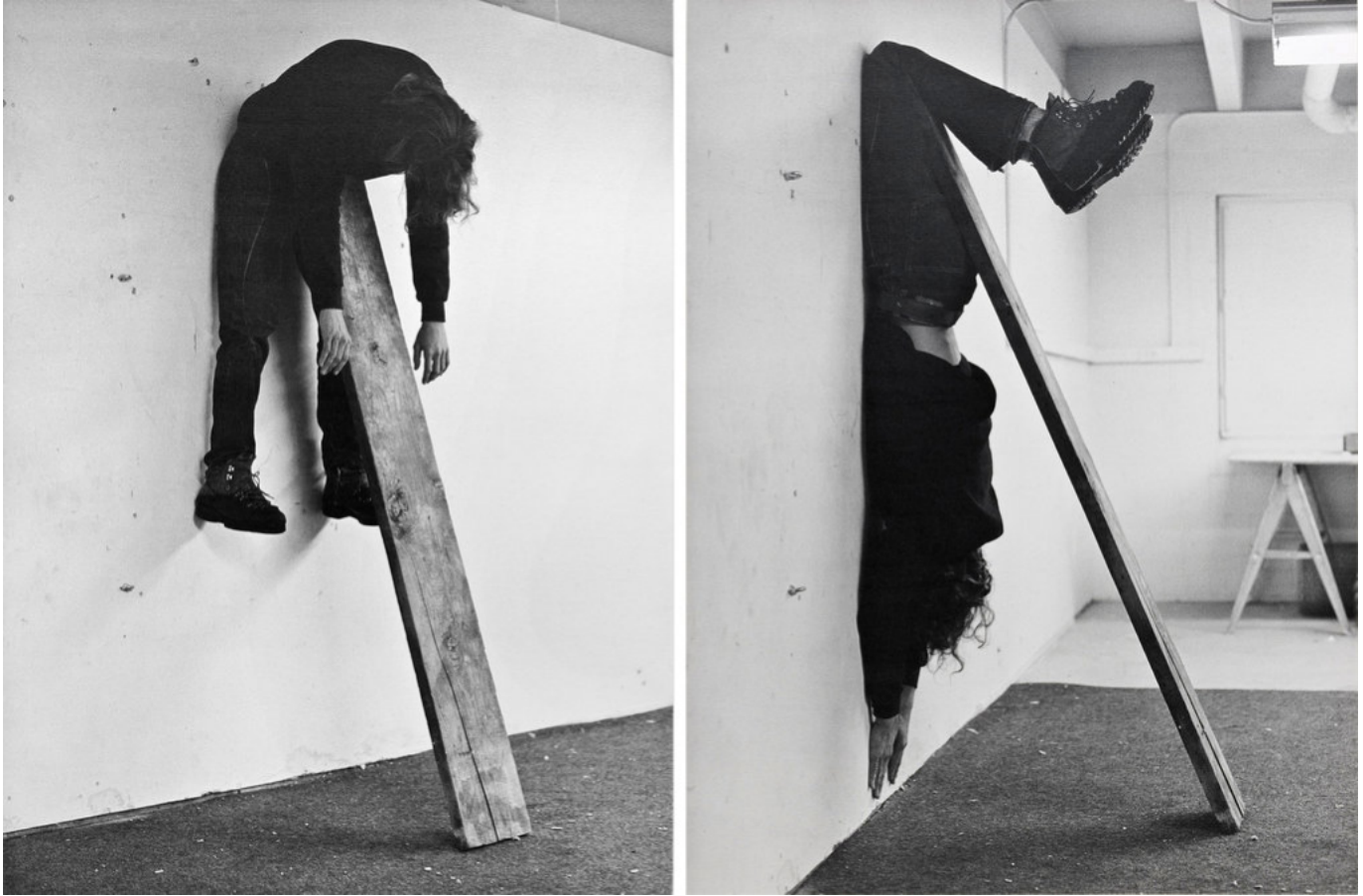
Charles Ray, Plank Piece, 1973