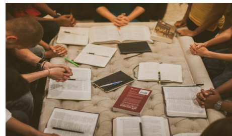
Katia Enriquez O'Meara

alumnos lo lean, se espera que así sea y que se convierta en algo respetado y valorado, por que su objetivo es agradar, ser algo de lo que hablar con cariño y apreciación, un medio por el cual estamos todos conectados.